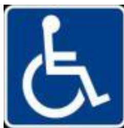
สัญลักษณ์คนพิการ