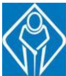
สัญลักษณ์ผู้สูงอายุ

องค์การบริหารส่วนตำบลมาโมง โทร./โทรสาร. ๐๗๓-๗๐๙๗๙๐